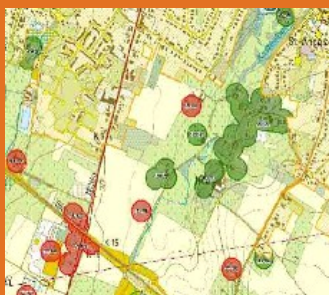
Uittreksel uit een zoneringsplan

Deze folder legt u uit wat een IBA installeren in de praktijk betekent en hoe uw gemeente en uw waterbedrijf u hierin kunnen ondersteunen.